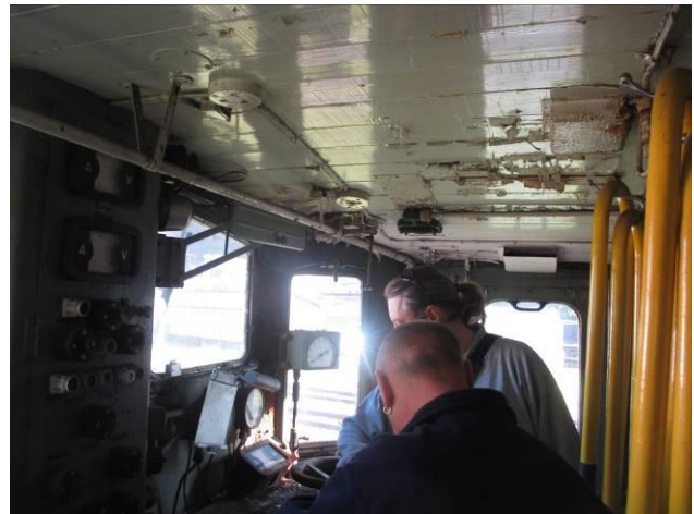
Für die Innenrenovation haben wir noch keine Offerte