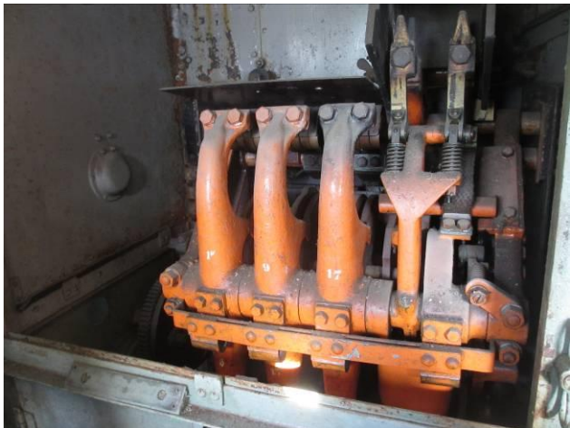
Diese MFO-Stufenschaltung sollte sichtbar bleiben