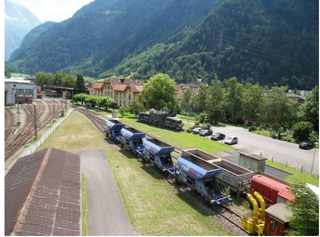
Hier sind bald Parkplätze des Interventionszentrums der AlpTransit