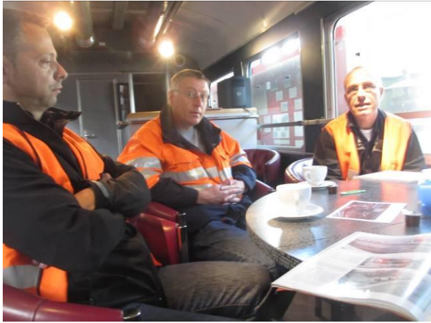
Strategie-Gespräche auf ehemaligen SBB-Bundesratsstühlen