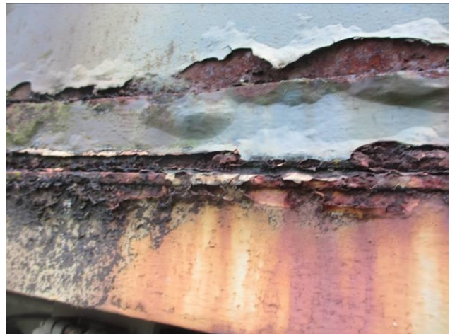
30 Jahre stand sie hier draussen, das zeigt sich halt schon