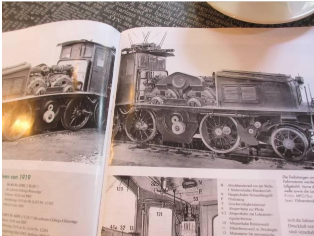
Varianten der Sichtbarkeit des Inneren – und Prospektideen