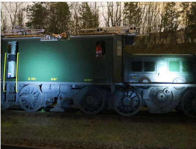
Hier wird sie nun einige Monate auf ihr künftiges Zuhause warten