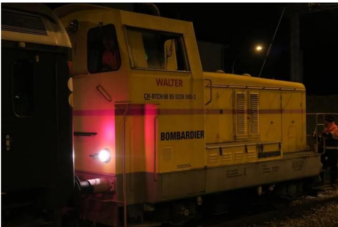
Die letzten Meter aufs Bombardier Gelände erledigt deren Diesellok