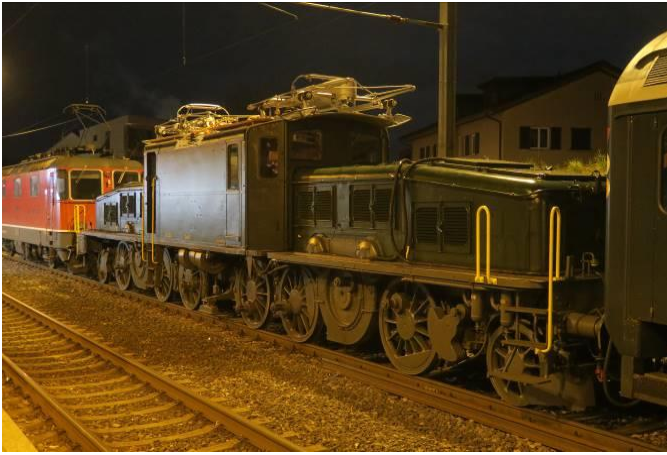
Pünktlich um 2 h kommt die Komposition am Bahnhof Seebach an

1920 hier gebaut kommt die CE 6/8 14270 98-jährig am 4. Feb. 2018 heim nach Oerlikon