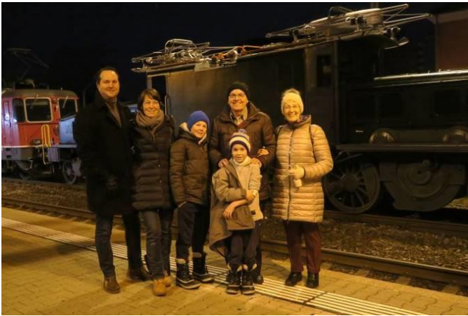
Diesen historischen Moment möchte auch die Familie nicht verpassen