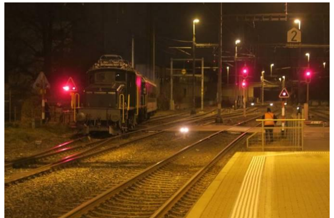
Rund 1 km folgt man zu Fuss den beiden Loks auf den Geleisen