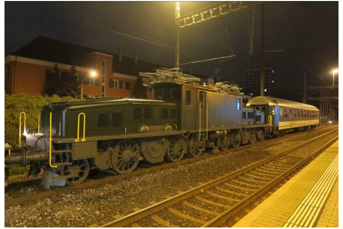
Erstaunlich geräuschlos rollt sie an und sieht nachts aus wie neu