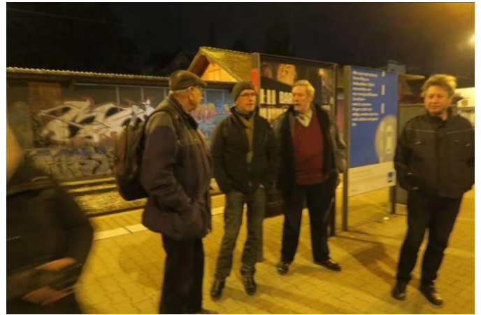
Eingeschworene trainspotters erleben Spektakel statt Bettwärme